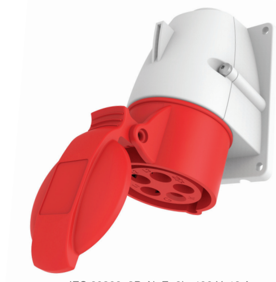
IEC 60309, 3P+N+E, 6h, 400 V, 16 A